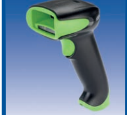
RFID, Scanner & Mobile Datenerfassung