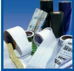
Etiketten & Farbbänder