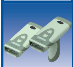
RFID, Lesegeräte & Datenerfassung