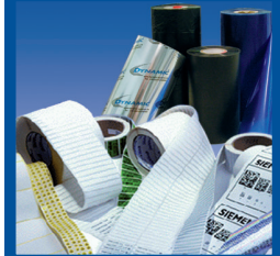
Etiketten & Farbbänder